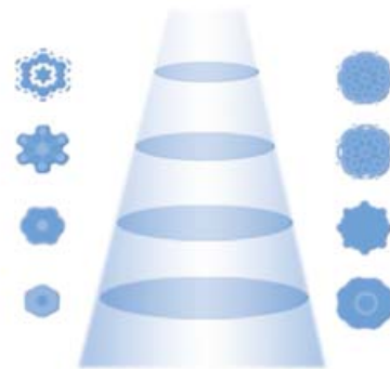
Conception à 9 cristaux

A grandes profondeurs, un capteur conventionnel à 7 cristaux présente une région focale plus étroite.